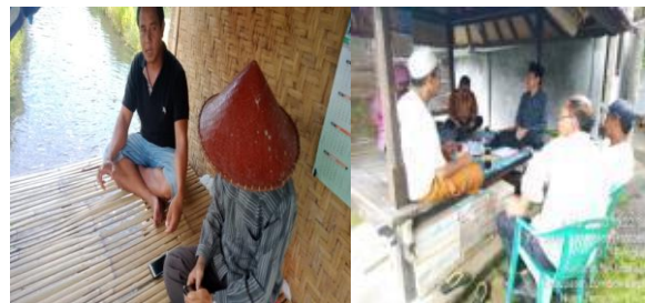
Gambar 3 Survey Pendahuluan

Berdasarkan permasalahan yang ditemukan di kelompok Cangkrung Jaya yang terletak di Dusun Bengkel Barat Desa Bengkel Kecamatan Labuapi Kabupaten Lombok Barat, team pengabdian masyarakat berinisiatif melakukan proses administrasi keuangan, manajemen bisnis, penguatan kelompok sebagai solusi untuk meningkatkan taraf hidup masyarakat dengan melakukan beberapa kegiatan diantaranya tahap awal yaitu melakukan survey lokasi dan melakukan diskusi kecil ringan dengan kelompok Cangkrung Jaya Seperti yang terlihat pada gambar berikut ini :