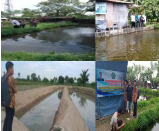
Gambar 1 Lahan Budidaya Air Tawar

Diawal pendirian kelompok Cangkrung Jaya dalam pengelolaan usaha melakukan pencatatan pembukuan dan mempunyai administrasi yang lengkap. Hal ini terlihat dari adanya nota-nota setiap terjadinya transaksi, terdapat berbagai macam buku diantaranya daftar hadir anggota kelompok, surat masuk dan surat keluar, buku rencana kerja kelompok, buku kas, buku inventaris, buku agenda rapat dan buku tamu.