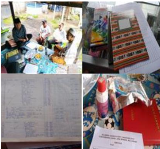
Gambar 4 Kegiatan Pengabdian

pelatihan yang diberikan sebelumnya. Pada Rabu 4 Maret 2020 memberi contoh dan membuat arus kas masuk dan keluar. Kemudian Rabu 11 Maret 2020 dilakukan penyusunan inventaris kantor, selanjutnya hari rabu 18 Maret 2020 belajar untuk menyusun laporan laba-rugi dan neraca. Dan hari terakhir tanggal 25 Maret 2020 melakukan evaluasi sejauh mana kelompok mampu membuat laporan keuangan sederhana. Hasil yang dicapai kelompok Cangkrung Jaya mampu menyusun laporan keuangan sederhana. Berikut gambaran kegiatan yang dilakukan pada kelompok Cangkrung Jaya yang terlihat pada gambar di bawah ini :