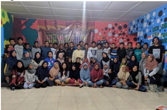
Gambar 2. Foto bersama antara mahasiswa KKN-PPM dan organisasi pemuda Desa Penagan setelah melakukan koordinasi mengenai program KKN-PPM di Desa Penagan