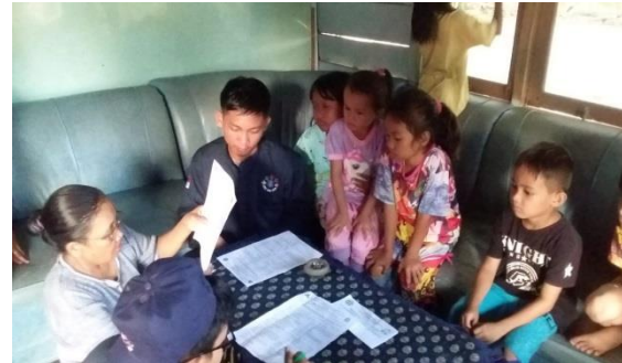
Gambar 3. Salah satu mahasiswa KKN-PPM sedang melakukan wawancara kepada warga Desa Penagan untuk pengisian kuesioner sebelum pelaksanaan program KKN-PPM.

pelaksanaan KKN-PPM di Desa Penagan. Penyebaran pun dilakukan secara acak di pemukiman masyarakat yang terkena dampak langsung dari kegiatan KKN-PPM Desa Penagan. Kuesioner ini ditujukan untuk mengetahui kondisi masyarakat sebelum program KKN-PPM dilaksanakan.