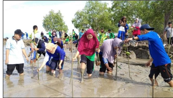
Gambar 5. Penanaman pohon oleh tim KKN-PPM bersama masyarakat Desa Penagan (Amelia dkk, 2019).