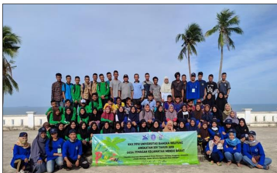
Gambar 4. Foto bersama masyarakat saat kegiatan penanaman pohon dan gerakan kebersihan di sekitar pesisir pantai Tanjung Raya, Desa Penagan.

Selain itu, instansi pemerintah dan lembaga lainnya juga ikut berpartisipasi dalam pelaksanaan kegiatan, baik sebagai narasumber maupun sebagai mitra dalam mempublikasikan hasil kegiatan KKN-PPM Desa Penagan. Adapun instansi atau lembaga yang berpartisipasi tersebut adalah: Dinas Kehutanan Provinsi Bangka Belitung, Dinas Perindustrian dan Perdagangan (Disperindag), Himpunan Pengusaha Muda Indonesia (HIPMI) Bangka Belitung, Laskar Pelangi (Laspela) Group, Komunitas Becak Babel, Harian Laskar Pelangi dan Terbitan Group.