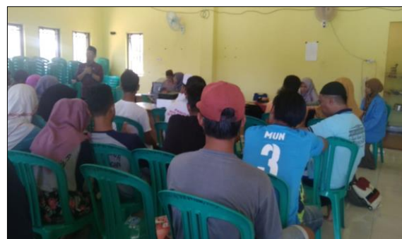
Gambar 6. Partisipasi masyarakat Desa Penagan dalam kegiatan sosialisasi.